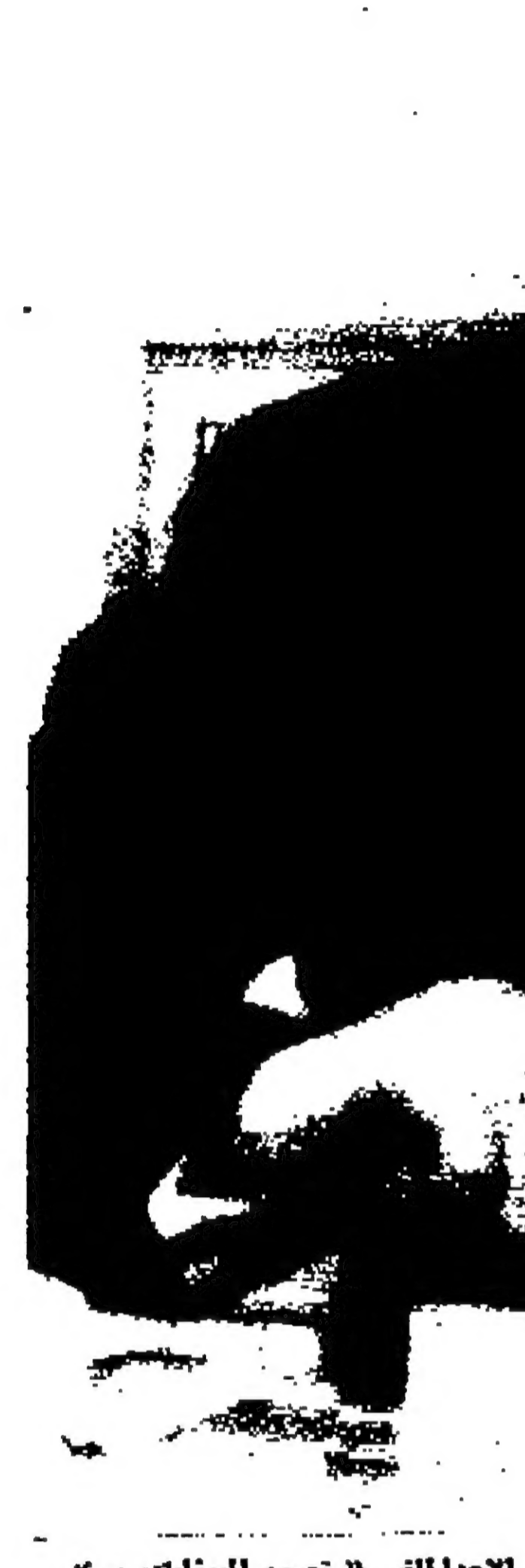
الرئيس الفرنسي شارل ديغول يفتحه في الانتخابات العامة يوم الاحد الماضي

وسيجري الوزير الهندي خلال هذه الزيارة محادثات مع الزعماء الاثراك.